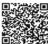
กิจกรรมที่ ๑