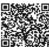
กิจกรรมที่ ๒