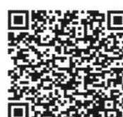
กิจกรรมที่ ๓