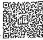
Android Version 6.0 ขึ้นไป

๒. แอปพลิเคชัน "CGD iHealthCare" โดยการดาวน์โหลดแอปพลิเคชันด้วยโทรศัพท์มือถือ และลงทะเบียนก่อนเข้าใช้งาน ตามรายละเอียด QR-Code