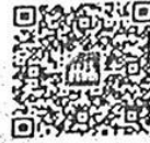
iOS Version 10.3 ขึ้นไป

หากผู้มีสิทธิตรวจสอบข้อมูลแล้วพบว่า ไม่ถูกต้องและ/หรือไม่เป็นปัจจุบัน ขอให้ยื่นแบบคำขอเพิ่ม/ปรับปรุงข้อมูลในฐานข้อมูลบุคลากรภาครัฐ (แบบ ศ๑๒๗) สามารถดาวน์โหลดแบบฟอร์มได้ที่เว็บไซต์ของกองการเจ้าหน้าที่ Banner ชื่อ ดาวน์โหลดแบบฟอร์ม หัวข้อเรื่อง แบบฟอร์มสวัสดิการรักษายาบาล พร้อมทั้งแนบเอกสารที่เกี่ยวข้อง ต่อนายทะเบียนของส่วนราชการต้นสังกัด เพื่อดำเนินการปรับปรุง และแก้ไขข้อมูลให้ถูกต้อง และเป็นปัจจุบันต่อไป